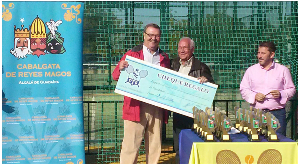
Torneo de pádel organizado por el Club de Tenis Oromana de Alcalá a beneficio de la Cabalgata.

■ El esperado 5 de enero, uno de los días más importante para todos los niños y mayores, SS, guiados por su Estrella de Oriente comienzan su mágica andadura, visitando a las 13:15 horas el Santuario de Nuestra Patrona la Virgen del Águila Coronada y postrándose ante Nuestra Madre, hacen las ofrendas reales del Oro, Incienso y Mirra al Niño Jesús. Seguidamente se dirigen a la Casa Consistorial para, sobre las 14 horas, ser recibidos por el Señor Alcalde y el Pleno Municipal y donde en un acto solemne se les hace entrega de las llaves de nuestra Ciudad. Continuando con las visitas programadas antes de la salida oficial de la Cabalgata, se dirigen a