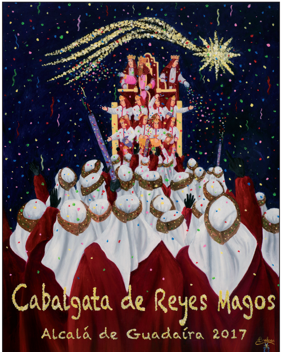
Cartel anunciador de la Cabalgata 2017, obra de José Luis Bulnes Portillo.