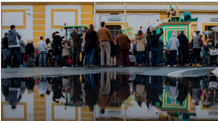
Primer premio de fotografía, autor D.Juan Jiménez Quintana.