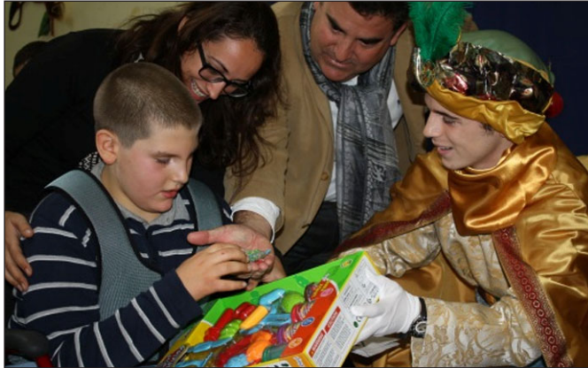
Entrega de regalos en Molinos del Guadaíra.

Las experiencias vividas van determinando los actos de cada persona, aprendiendo de ellas