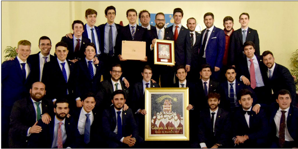
Grupo joven de la Cabalgata.