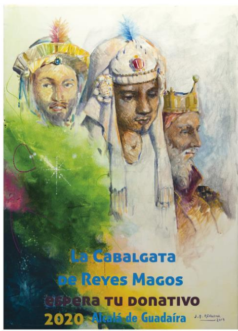
AUTOR DEL CARTEL: JOSÉ MARTÍNEZ RECACHA

QUE EL NIÑO JESÚS NOS BENDIGA A TODOS EN ESTAS NAVIDADES Y QUE LOS REYES MAGOS HAGAN REALIDAD NUESTROS SUEÑOS FELIZ NAVIDAD